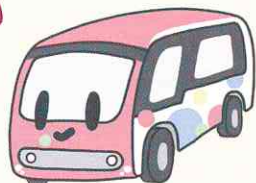
若者議会認定「Sバスキャラクター」 ゆっくる

※撮影の際は私有地等には無断で入らず、 許可が必要なものは許可を得てから撮影してください